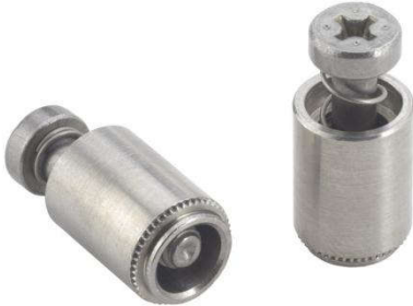
尺寸数据 (单位: 毫米 mm)

编码规则 JPFC2P - 632 - 40 ↓ ↓ ↓ 类型 螺纹 螺钉 代码 长度代码