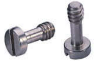
尺寸数据（单位：毫米 mm）

螺纹等级：外螺纹，公制6g、英制2A 材料要求：300系列不锈钢 表面处理：钝化处理